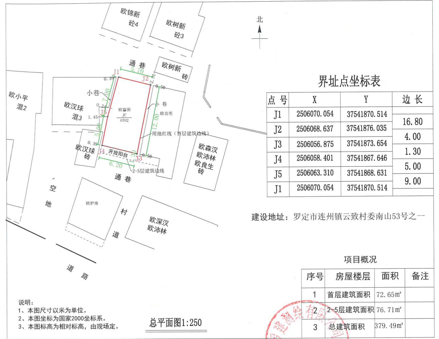
罗定市连州镇云致村委南山53号之一欧留新建房平面图