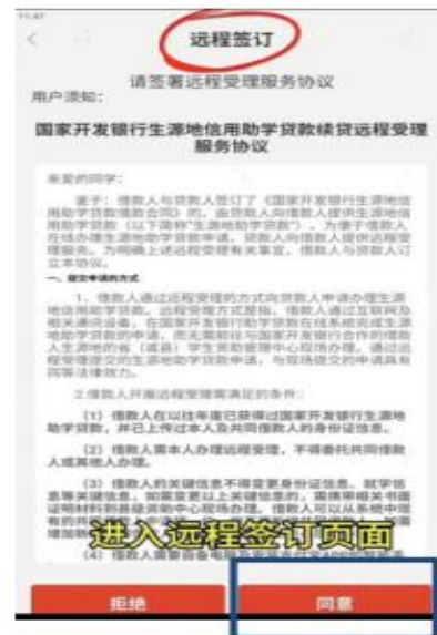
6. 同意远程签订合同授权书