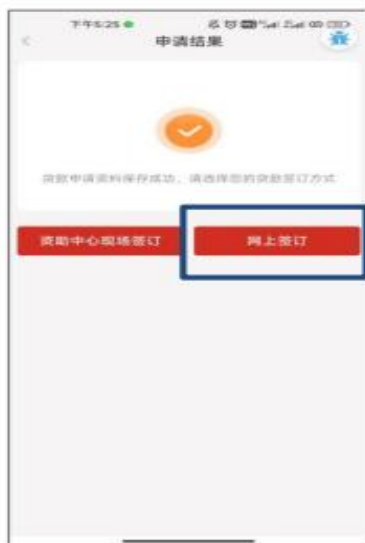
5. 选择“ 网上签订合同 ”